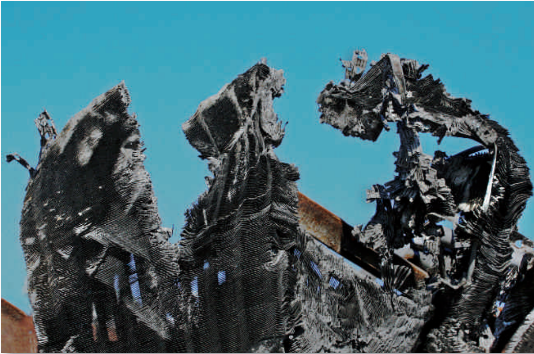
Abb. 2: Aus der Serie METALLOMORPHIE.

selbst“ ästhetisch fühlbar werden lassen. Dies kann unbeabsichtigt geschehen durch ihre Abnutzung in der Zeit, wobei ihnen wie bei antiken Statuen oder alten Gemälden Patina als „ästhetischer Mehrwert“ zuwächst. In der Kunst der Moderne kann dieser Prozess demgegenüber durchaus beabsichtigt sein, wie es jüngst in besonders monumentaler Weise Richard Serra vor Augen geführt hat: „Die Materie der Zeit“ heißt seine vor gut einem Jahr vor dem Guggenheim-Museum in Bilbao aufgestellte riesenhafte Skulptur aus vielen Tonnen rostenden Stahls, die in einigen Jahren in reinstem Oxyd-Orange erstrahlen wird. Das Beispiel des rostenden Stahls zeigt, dass Verwitterung getreu den Erhaltungssätzen der Physik nur in sehr kurzfristiger Betrachtung Zerstörung, Schwund und Tod bedeutet. Eigentlich geht es um eine Interaktion von Stoffen, um Metamorphose, wie sich dies außerhalb der Kunst in einem zeitlich wie räumlich überaus erhabenen Format an der Verwitterung ganzer Gebirge studieren lässt.