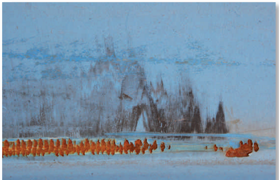
Abb. 5: Aus der Serie NACHTSTÜCKE UND TRAUMWERK.

Dieses im November 2007 begonnene Teilprojekt macht die wenig beachtete „andere Seite“ des Rheintals zum Thema einer durch Fotografien ergänzten ästhetischen Reflexion. Es geht vor allem um die Physiognomik absterbender Vegetation und die damit verbundene „Skelettierung“ der Landschaft, die wiederum deren geomorphologisch zu beschreibende bzw. zu rekonstruierende Gestalt deutlicher hervortreten lässt. Zur empirischen Anreicherung des Projekts ist eine interdisziplinäre Kooperation mit dem Fachbereich Biologie und dem Fachbereich Geowissenschaften avisiert. Ein wichtiger Forschungsaspekt ist die Auswertung historischer Dokumente und literarischer Zeugnisse zur Winterseite des Rheintals.