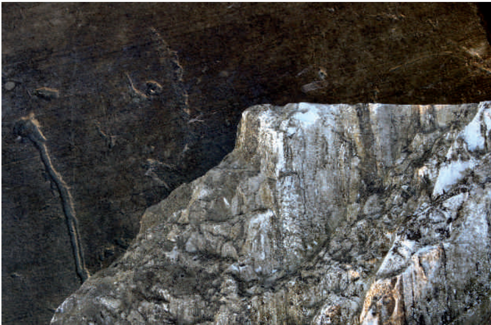
Abb. 3: Aus der Serie CARRARA.